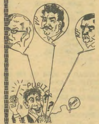
Die Wapad wonder watter twee ballonhe Woensdag in Potch. gaan bars.

terdag deur die Departement Studie en Navorsing van die A.S.B. aan die Pretoriase Onderwyskollege gereël is.