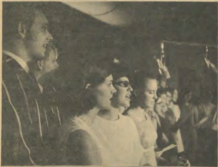
Die Alabama-groep tydens die verfilming van Banana Beach. Die film word in Juliemaand vrygestel.