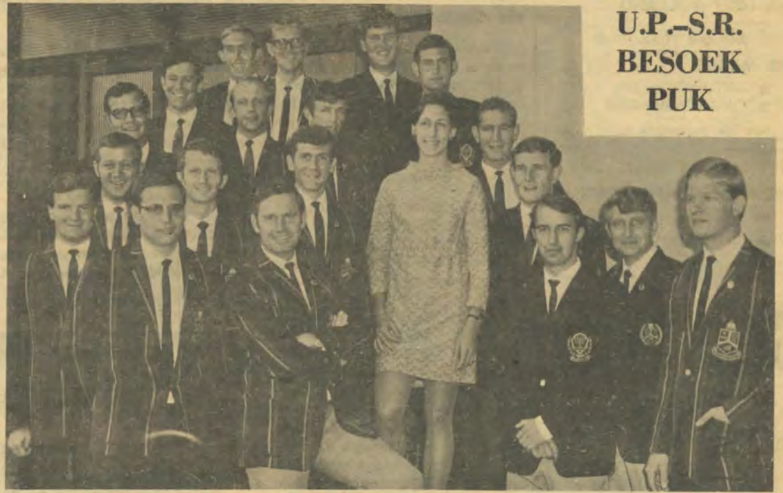
U.P.-S.R. BESOEK PUK

S.R.-lede van die Universiteit Pretoria het op Maandag 13 April 'n welwillendheidsbesoek aan die Puk se studenteraad gebring. Hierdie besoek vorm deel van 'n reeks sodanige besoeke wat die Tukkies in die vooruitsig stel.