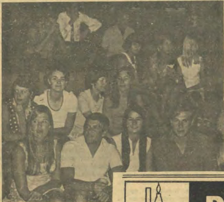
'n Groepie Pukke by Kuesta '70 nadat hulle 'n braaivleisete genuttig het. Dit het plaasgevind op die kampus van N.K.P.

Ja nee, almal stem vir 'n ruiker vir diegene wat hulle akademie opsy geskuif het om so 'n puik geslaagde aksie te organiseer en met weinig haakplekkies te laat verloop.