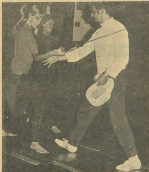
Die skermklub gaan nog steeds van krag tot krag. Hier is twee lede besig om die fynere kunsies te leer.

Tensy anders vermeld word, is alle berigte met 'n politieke strekking, versorg deur D. J. Swanepoel van die P.U. vir C.H.O., Potchefstroom.