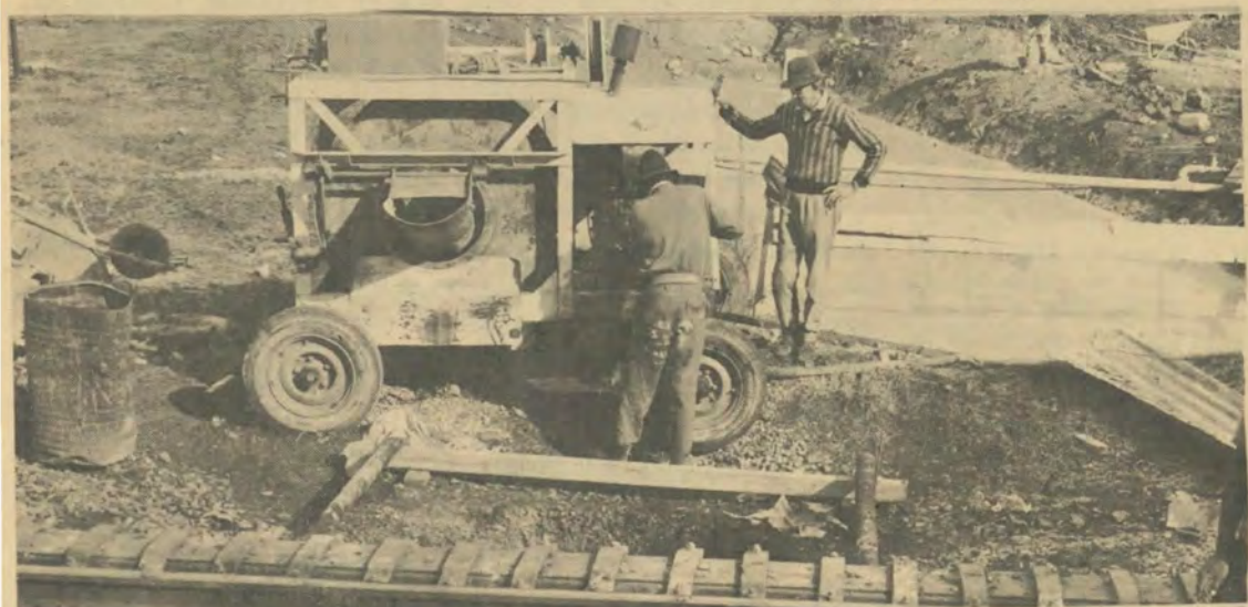
Werk aan die deurgang onder die reynspoor het reeds begin in die omgewing van Karliendameskoshuis.