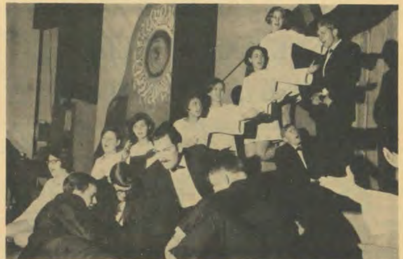
Alabama, die opspraakverwekkers. (Foto: Fotokuns).

lers nie, maar die afgerondheid van die hele opvoering, wat getuig van baie ure se skaaf. Sy ken die stuk