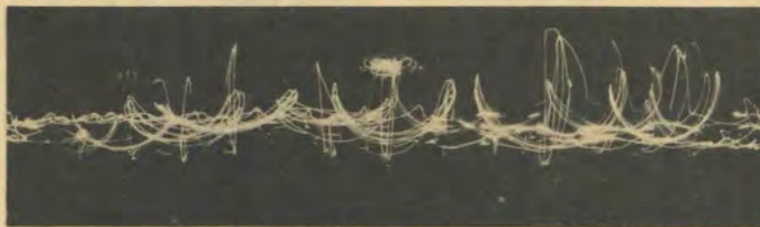
Die ligensensie van Revue '69.

HIERDIE IS 'N VERRASSINGSAAK. — Verrassende wendinge in die stuk self, 'n verrassende klimaks en verrassendste van alles: verrassend goeie toneelspel. 'n Mens gaan nie na 'n opvoering deur studente met die doel om rafels en rygsdrade uit te snuffel nie, maar selfs die hiper-kritiese oog sal in Thalia se opvoering van Lokval vir 'n een-same man, veel vind om te waardeer en geniet.