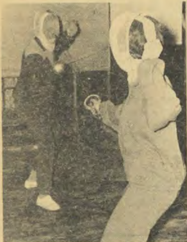
Nie in die Middeleeue nie, maar die herlewing van die skermklub op die Puk. „Veglustiges” oefen op Dinsdag- en Donderdagaande in die Hoofgeboussaal.