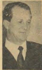
— DR. TREURNICHT

Hy praat by uitstek die taal van die volk met die volk... letterlik en figuurlik. Elke ware leier van 'n volk is die handhawer van daardie