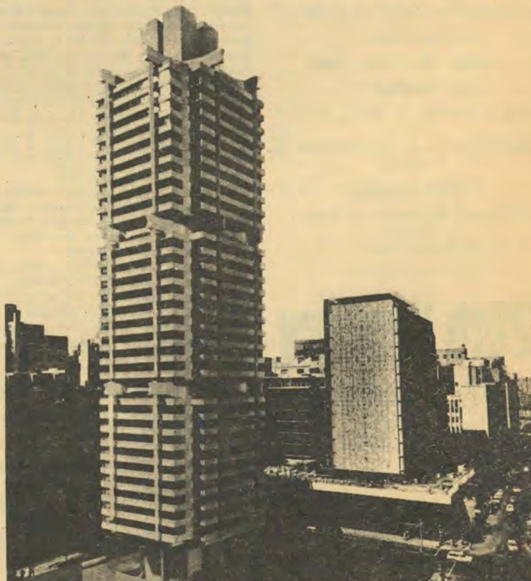
'n Argitektuurvoorstelling van die Standard Bank se reusesentrum van R16 miljoen in Johannesburg.