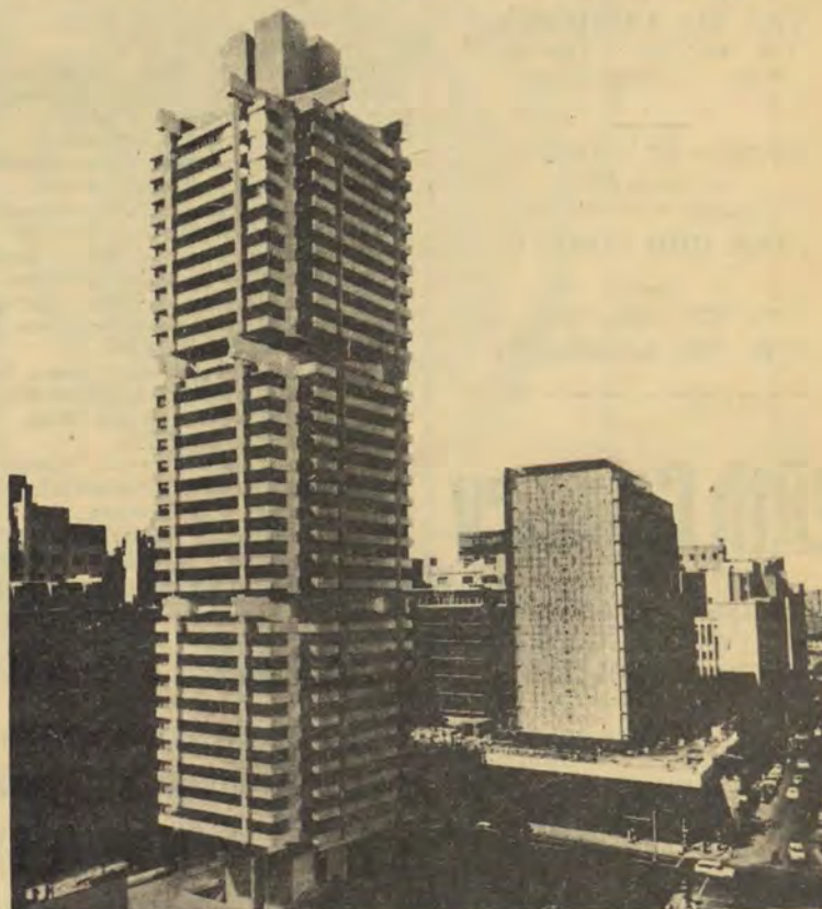
'n Argitektuurvoorstelling van die Standard Bank se reusesentrum van R16 miljoen in Johannesburg.