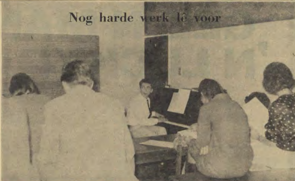
„Sjampanjevertoning” is Revue '68 verlede jaar genoem, maar die voorbereiding daarvoor is nie elke aand sjampanje en kaviaar nie, want daar moet hard gewerk word. Op die foto word 'n liedjie vir die soveelste keer gesing totdat dit eksie-perfeksie is.