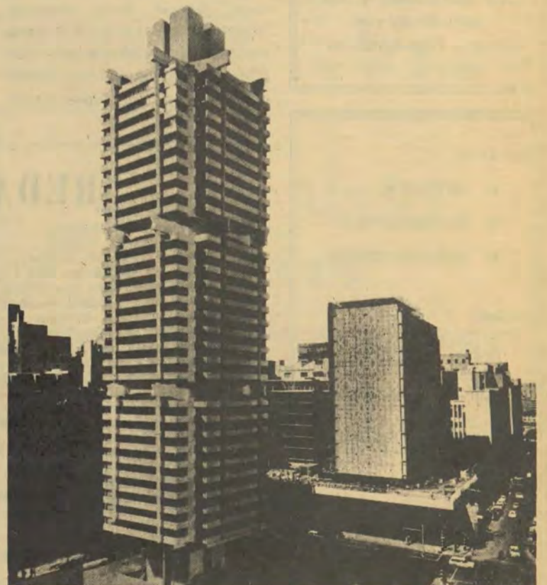
'n Argitektuurvoorstelling van die Standard Bank se reusesentrum van R16 miljoen in Johannesburg.