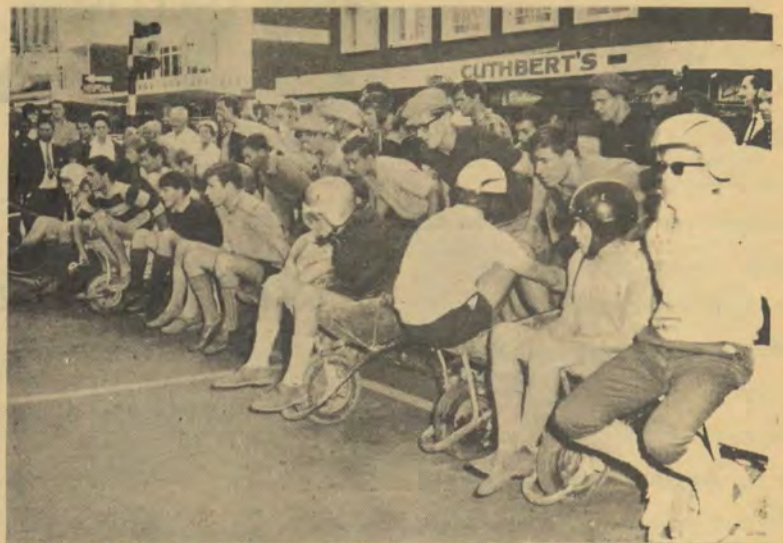
Gereed...! Hefaan lê voor en die wenstreep is ver, kruiswaens se wiele is ge-olie en die masjiene het brandstof ingeneem vir dié uithouwedren van 1969!