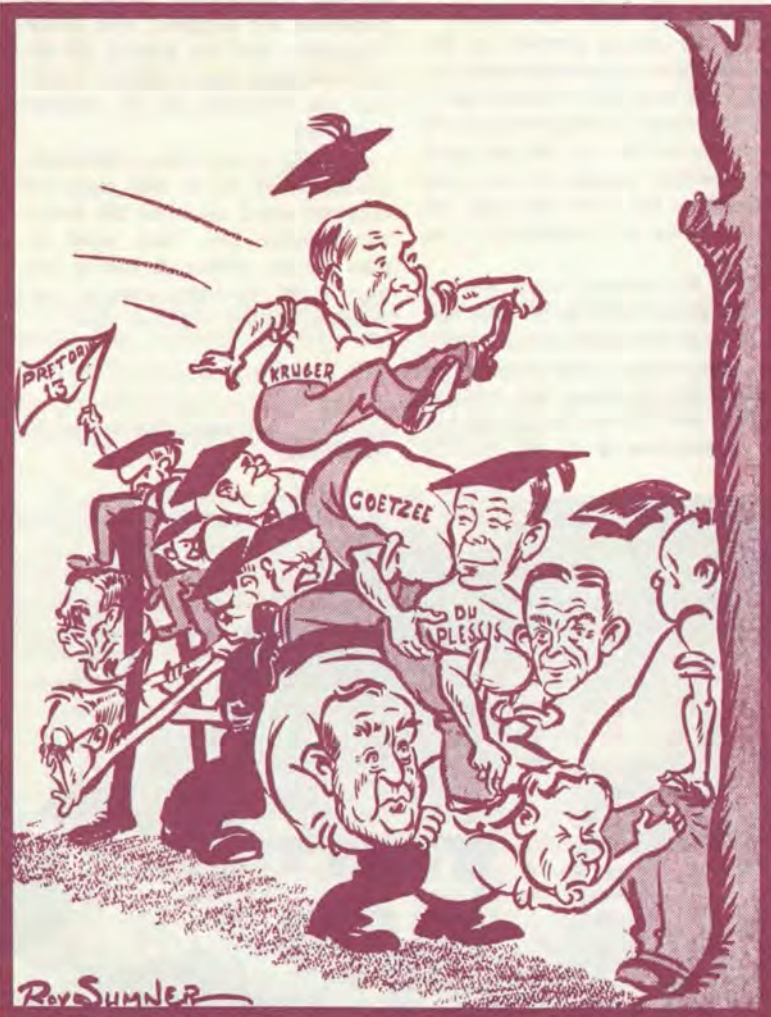
So het 'n spotprenttekenaar van die Sunday Times die roeringe op Potch as 'n dilemma vir die regering voorgestel.