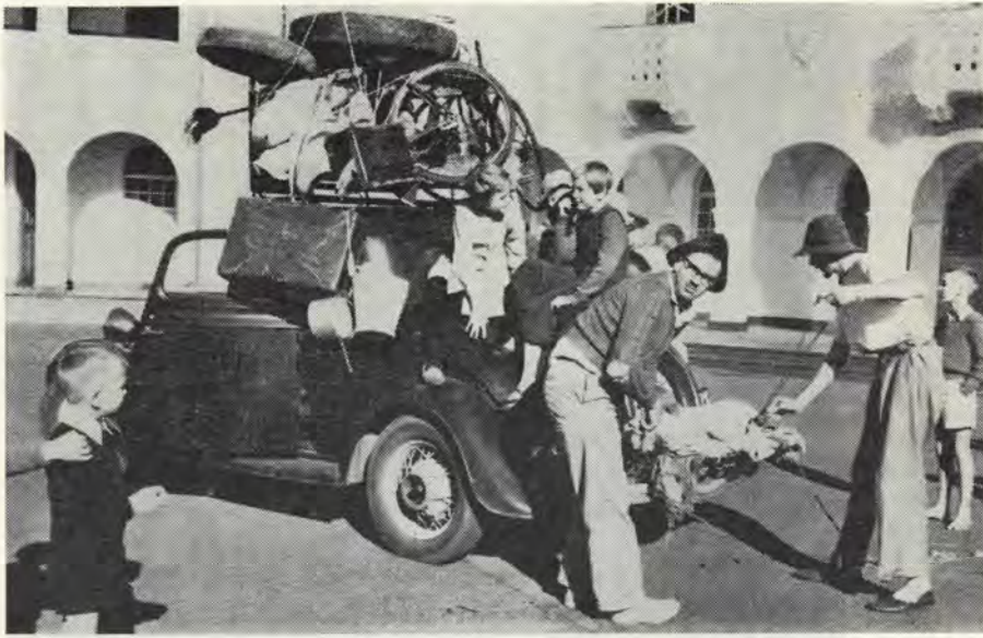
'n Studenteouerpaar gereed om te vertrek vir vakansie — studente-oorspronklikheid wat vir baie (on-ingewydes) pure stuitigheid is...