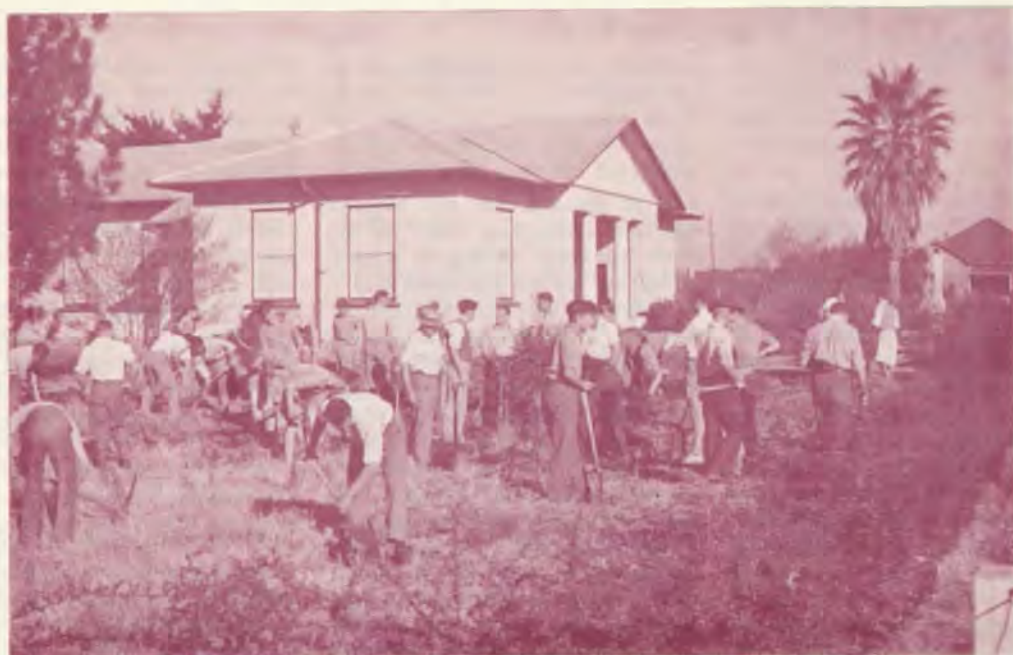
’n Ongewone gesig — studente wat in die tuin werk. Die oueres sal sê: die goeie ou dae. Ons vandag sal sê: dit was toe studente nog tyd gehad het vir sulke dinge...

Dit dan so ’n paar grepe uit daardie veelbewoë tyd. Die universiteit staan nog op dieselfde plek en daar is nog studente. Alles is net baie meer en mooier as destyds. Dit lyk ook of daar vrede op die kampus heers. Mag die studente daardie vrede geniet en benut, want dalk kom daar weer dae van beroering en... magteloosheid.