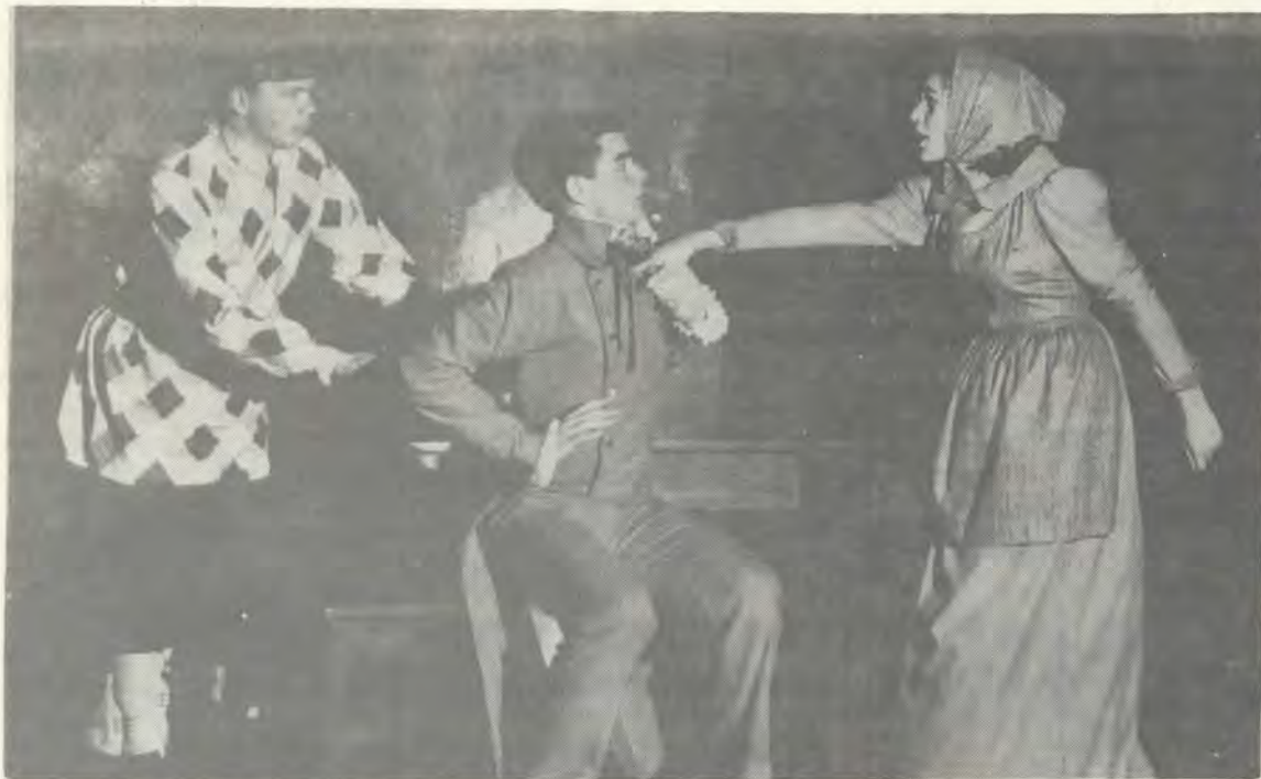
'n Toneeltjie uit die „INSPEKTEUR-GENERAAL” wat Vrydagaand in die Totiussaai aangebied word. Die Thalia-groep het gedurende die afgelope vakansie met die stuk getoer.