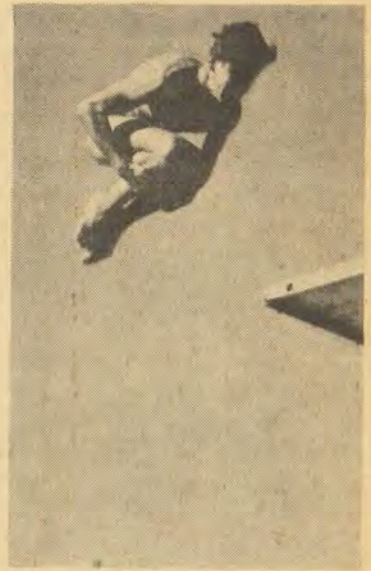
Bollemakiesie in die lug. Die foto is verlede week by geleentheid van die P. U. se sportkursusse in swem, geneem.