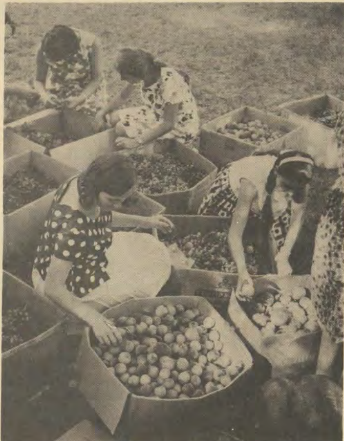
Vrugte in oormaat! Die A.S.B.-vrugtefees was vanjaar 'n groot sukses. Die dametjies op die foto kan blykbaar nie besluit watter vrugsoort die lekkerste sal smaak nie.

Die Abe Bailey Reisbeurs word nie alleen vir prestasie op akademiese gebied toegeken nie, maar ook op sportgebied en vir besondere leierskap.