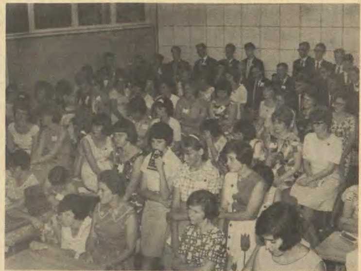
'n Groep nuwelinge luister met belangstelling (?) na 'n spreker tydens 'n samekoms van alle voornemende tennisspelers aan die P.U.