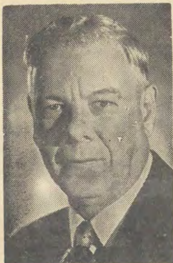
DR. H. F. VERWOERD