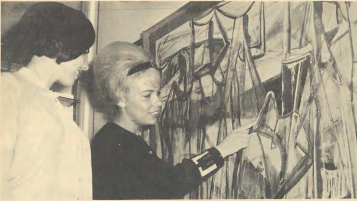
Die twee Pukdames vind 'n skildery van die Vlaamse skilder, Floris Jaspers baie interessant.