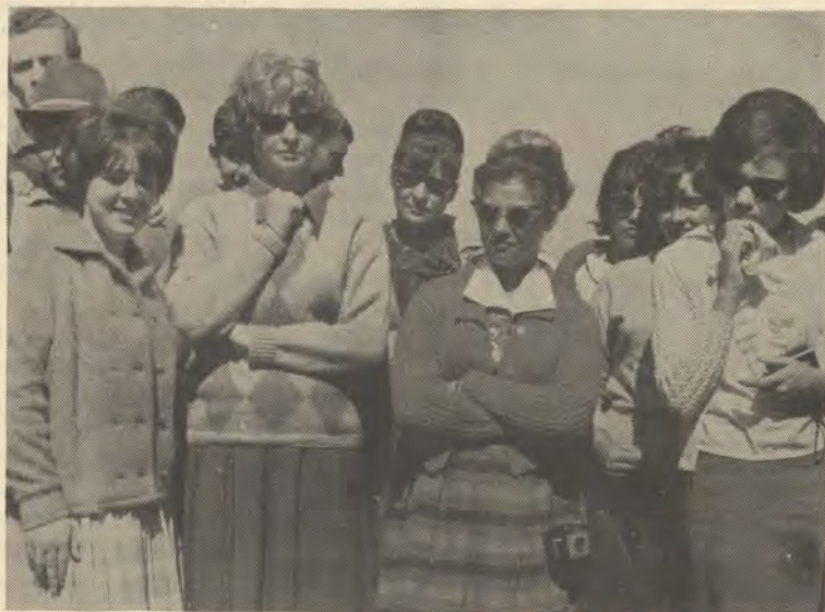
Lede van die toergroep kyk belangstellend toe terwyl die maak van bier aan hulle verduidelik word.