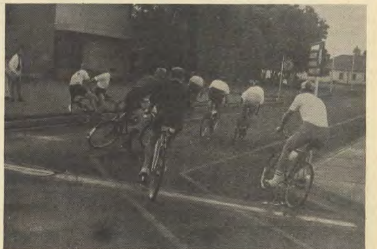
In 'n reklamerolprent wat tans van die P.U. gemaak word sal tonele soos hierdie gesien word. Die foto is geneem tydens die bekende „Om d'e kampus-fietsreisies”. 'n Span van Teologiese-studente het gewen.