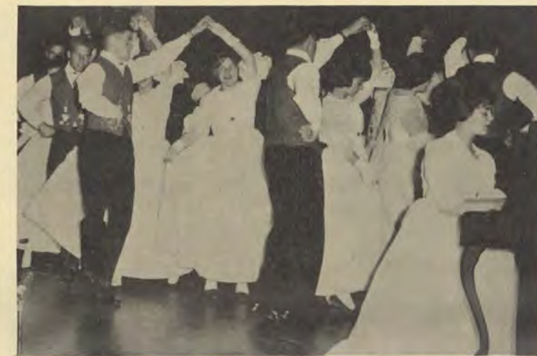
Gaan die volkspelers weer so maak? Die groep op die foto het tydens verlede jaar se A.S.B.-Kunsfees met die louere wegge-loop en is hier besig met 'n vertoning in die Totiussaal.

'n Aantal van sy beste werke is: Caesar ('n versdrama waarmee hy die Eugène Marais-prys verower het; in 1961, Lobola vir die Lewe (1962), Potpourri (1962), Sempre Diritto (1963), Die Ambassadeur (1963, wat hy self in 1964 in Engels vertaal), en Orgie (1965).