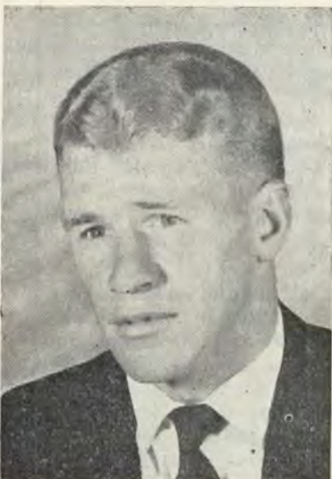
Piet van der Schyff Fotokuns