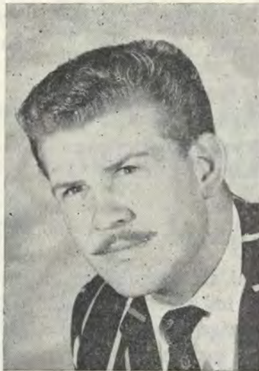
Koos du Plessis Fotokuns