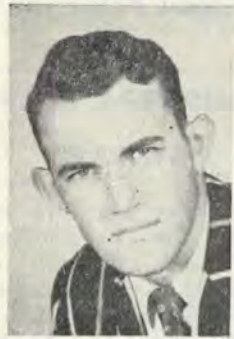
Lou Erasmus Fotokuns