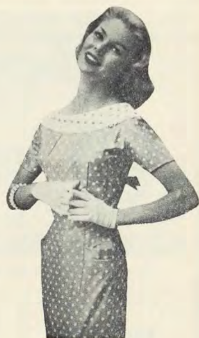
all by Teena Paige