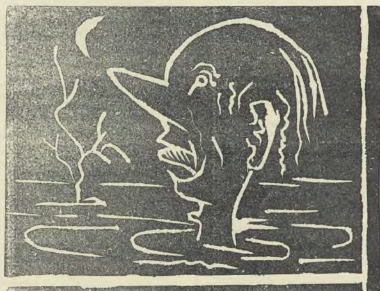
Baie drake het Vrydagnag 'n modderdood gesterf.

Stel ons egter 'n nuwe aksie in — noem dit 'n toeliggende verwelkoming of nog ontgroening of inlywing, as u wil — waartydens die eerstejaars wel deeglik moet beref, vanaf die oomblik dat hulle hieraanland, dat hulle hier as minder as niks beskou word, en sodoende, op heel natuurlike en effektiewe wyse ontroof word van daardie matriekkompleks; waartydens hulle (dore en drake) kennis kan maak op 'n gelyke maar tog gesegreerde basis (hoe weet ek self nog nie duidelik nie), om aan die tweede doelfaktor te voldoen; waartydens hulle deur goed georganiseerde en interessant opgediste voorligtingslesings (sonder enige kritiek op lesings wat