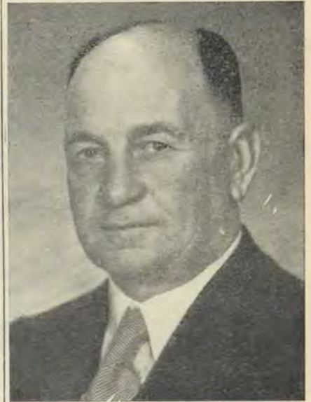
Sy Edele, Dr. J. H. Viljoen, Minister van Onderwys, Kuns en Wetenskap, wat as hoofspreker optree wanneer die Fisika-laboratorium Saterdag in gebruik geneem word.

By way of illustrating his address, two films were shown at the conclusion of the meeting. The first was the presidential nomination, the second about President Eisenhower's press conference.