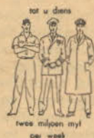
tot u diens twee miljoen myl per week

En ons kan besonder trots daarop wees dat die groot vervoerstelsel wat so 'n groot land per spoor, in die lug en op die grootpad bedien, aan ons behoort.