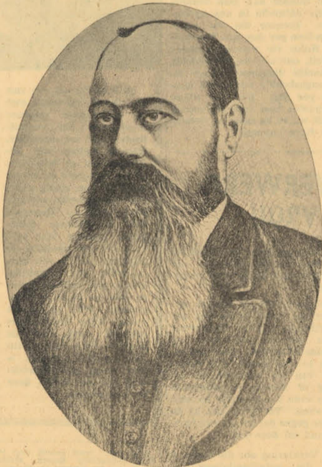
President Marthinus Theunis Steyn