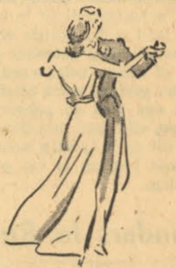
DANS VIR PLESIER