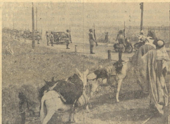
Op die foto skep koning Abdullah se motorstoet 'n skerp kontras met die Arabiese toeskouers en hul donkies wat so kenmerkend is van die land.

Koning Abdullah van Transjordanie, en hoof van die Arabiese magte in Palestina, word met 'n mate van agterdog bejeën in sekere Arabiese kringe. Volgens van Joodse kant berig word, word hy deur die Egiptiese openbare mening beskou as 'n verraaier. Dat Abdullah nie heeltemal onsimpatiek teenoor die Sionistiese beweging staan nie, word inderdaad ook berig deur die goed ingeligte blad Review of World Affairs, wat beweer dat hy in die geheim heeltemal te vinde is vir die gedagte van 'n verdeling van die land en 'n ooreenkoms met die Jode.