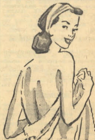
Vir persoonlike frisheid

Intussen het daar 'n stryd ontbrand oor die kwessie of die volkslied van Engeland by die Eufeëse te Pretoria gespeel Vervolg in kol. 3