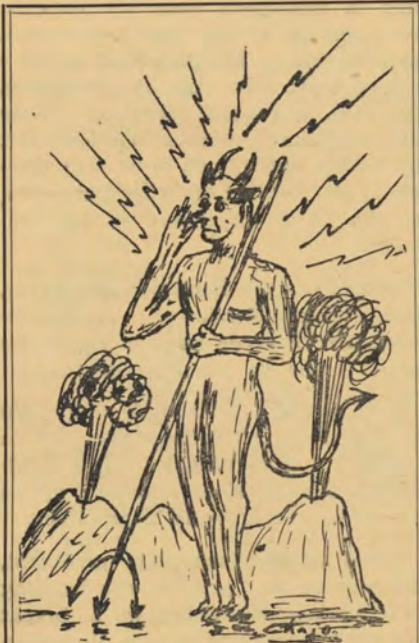
Duiwels wees getrou aan julle ideaal!

„Veragte, langstert, vurkdraende duiwelkollegas; die nuus is groot; die gesant is erken; nie met genoeë nie, maar ja-nee, so wil ons dit ook nie hê nie. Ons verwag geen tegemoetkoming nie, want dit sou medewerking beteken en ons wil geen medewerking hê nie. Nee, ons wil hê: alleenwerking, algehele ooreersing, en onderdrukking. Duiwels wees getrou aan julle ideaal! Waar ons ontvang word, daar heers ons. Ja, niemand ontvang ons openlik met blydschap nie . . . maar ons kruip in hulle harte in en werk soos 'n invretende suur.